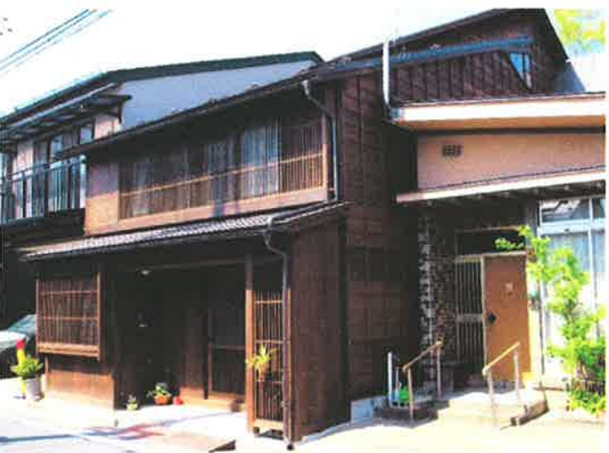
■盛岡町家の伝統的な形の専用住宅