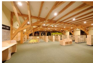
大槌町おしやち図書館